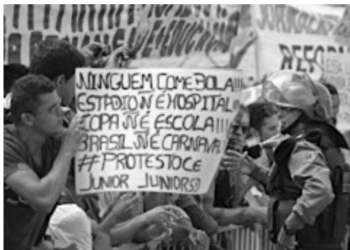
(Manifestação em Fortaleza em Junho de 2013)

Durante a realização da Copa das Confederações (junho de 2013), a imprensa nacional e internacional registrou inúmeras imagens de protestos ocorridos nas principais cidades brasileiras.