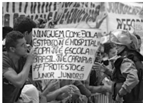
(Manifestação em Fortaleza em Junho de 2013)

Durante a realização da Copa das Confederações (junho de 2013), a imprensa nacional e internacional registrou inúmeras imagens de protestos ocorridos nas principais cidades brasileiras.