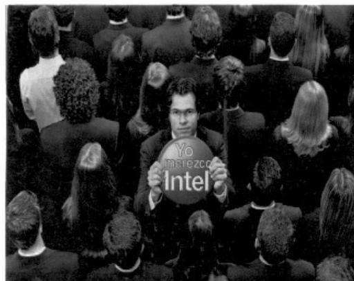
Imagen A Intel Brasil