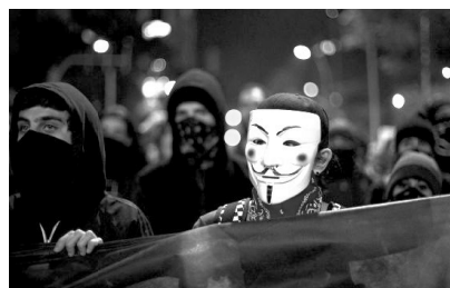
Manifstantes en las calles de São Paulo

Durante una de las manifestaciones de São Paulo del pasado mes de junio el corresponsal de la cadena Globo en Nueva York, Jorge Pontual, lanzaba en su Twitter : "Si la batería del Ninja no se muere, yo no duermo esta noche". El veterano periodista del medio más atacado durante las manifestaciones en Brasil se refería a uno de los integrantes del grupo Ninja que llevaba horas retransmitiendo la marcha desde su celular. (...)