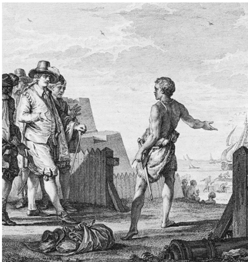
(Ilustração de Moreau le Jeune, in http://collections.lacma.org/node/225471 )

Imagem e legenda se referem a uma anedota então conhecida: um jovem hotentote fora trazido para a Europa e demonstrara grande aptidão em se adaptar e assimilar outra cultura. Mas, após uma visita aos seus parentes, decidiu voltar para os seus.