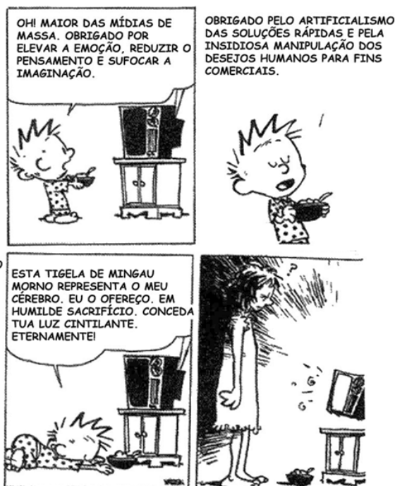
(WATERSON, Bill. Calvin e Haroldo . São Paulo: Best News, s/d, v. 2.)